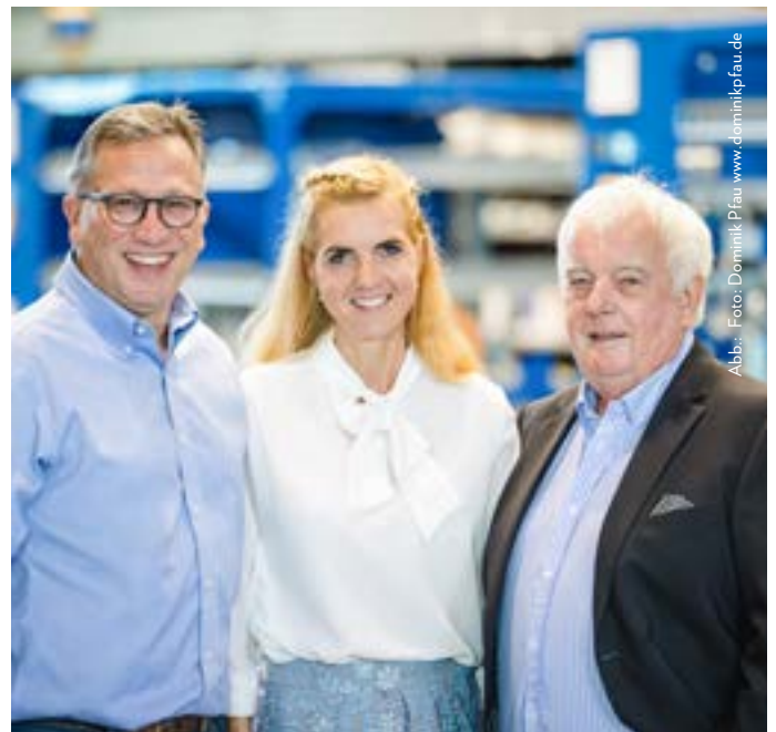
Abb.: Foto: Dominik Pfau www.dominikpfau.de

26 AUS DER WELT NACH HAMM Erfolgreiche Nachfolge beim Familienunternehmen Hauschild